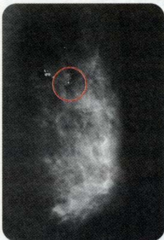
51歳女性 乳がんの石灰化の症例 (右乳房拡大)

マンモグラフィは乳腺の全体像を写し出すので、左右を比較して診ることができます。また、過去のフィルムと比較することによって、組織の微妙な変化をとらえることができます。